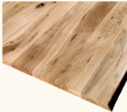
Eiche rustikal, scharfkantig