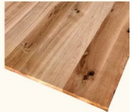
Eiche rustikal, mit Waldkante